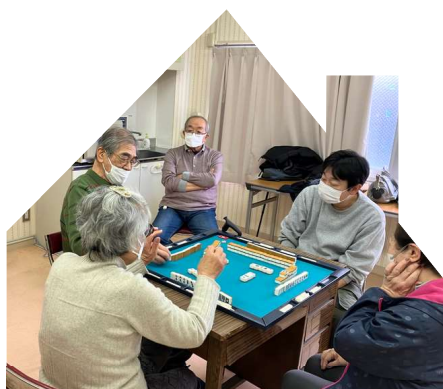
健康麻雀 12/24(火) 14:00~