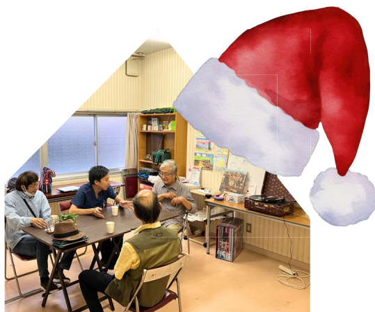
みのるーむ喫茶 12/21(金)~26(木) 10:00~12:00

同善会クリニック1Fにあるみのるーむを一週間開放します!! 午前中に喫茶、午後に楽しいイベントを開催しますので、 たくさんのご参加お待ちしております!!