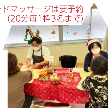
ハンドマッサージ 12/23(月) 14:00~16:00