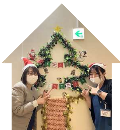
クリスマス装飾 12/20(金) 14:00~