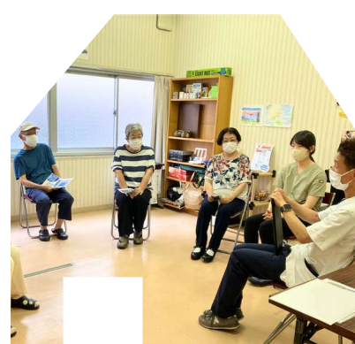
健康体操 12/26(木) 14:30~