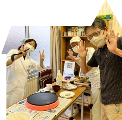
クレープパーティー 12/25(水) 14:30~